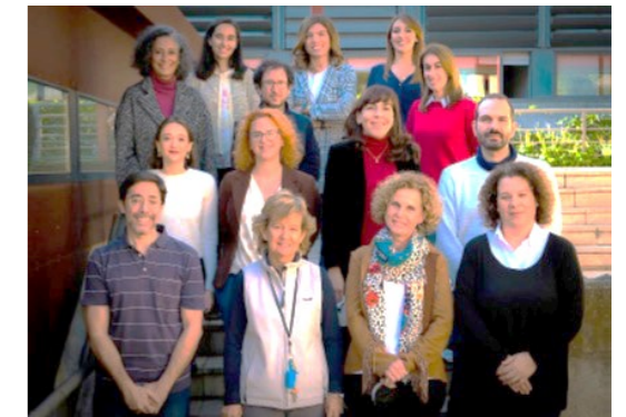
Equipo de Investigación de Parasitología e Inmunología

Me gusta leer sobre distintos campos del saber distintos de los míos, disfrutar de la compañía de mi familia y mis amigos, los árboles, especialmente los frutales y su cuidado.